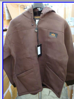
Felpa Termica Uomo Mod. 04 Vintage Made in Italy